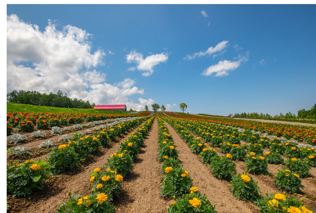
花畑も放射線を使いやすい被写体