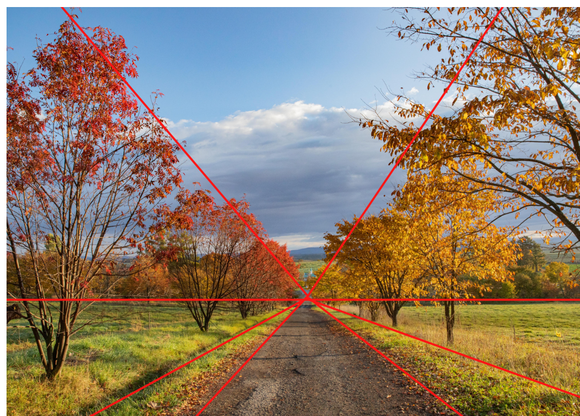
放射線+三分割+シンメトリーの構図で構成されています