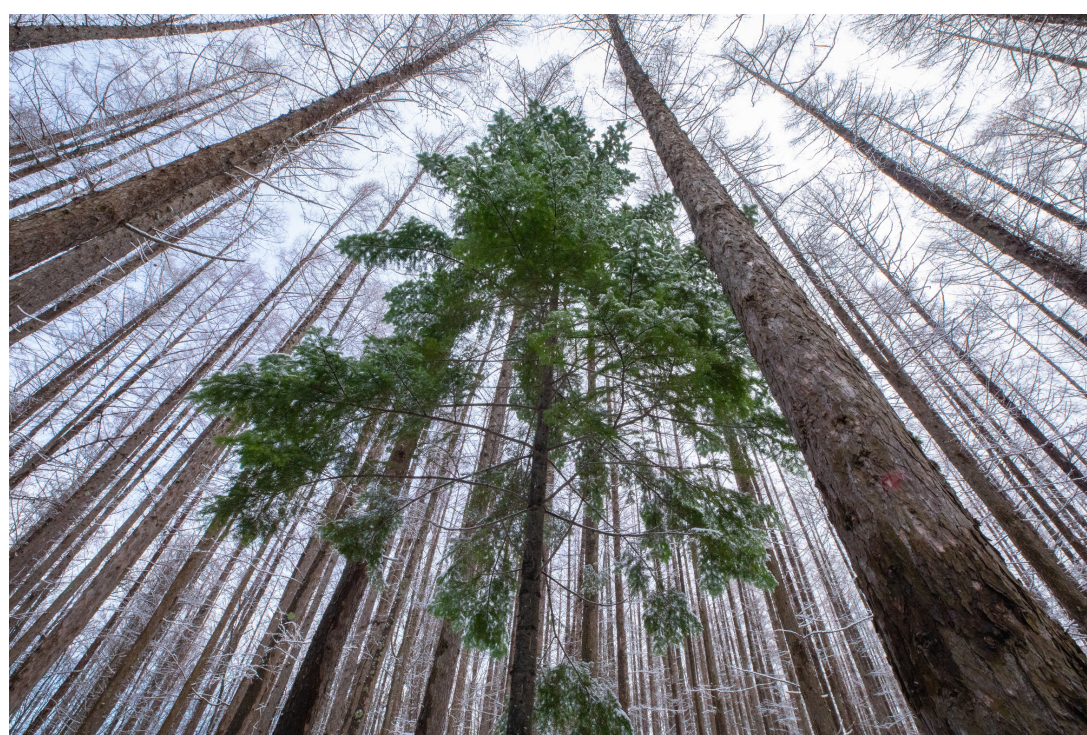
気持ちいいほど視線が誘導されますね^^