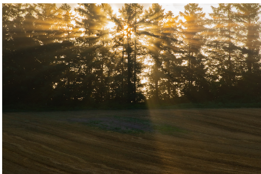
光芒は自然風景撮影の醍醐味のひとつ